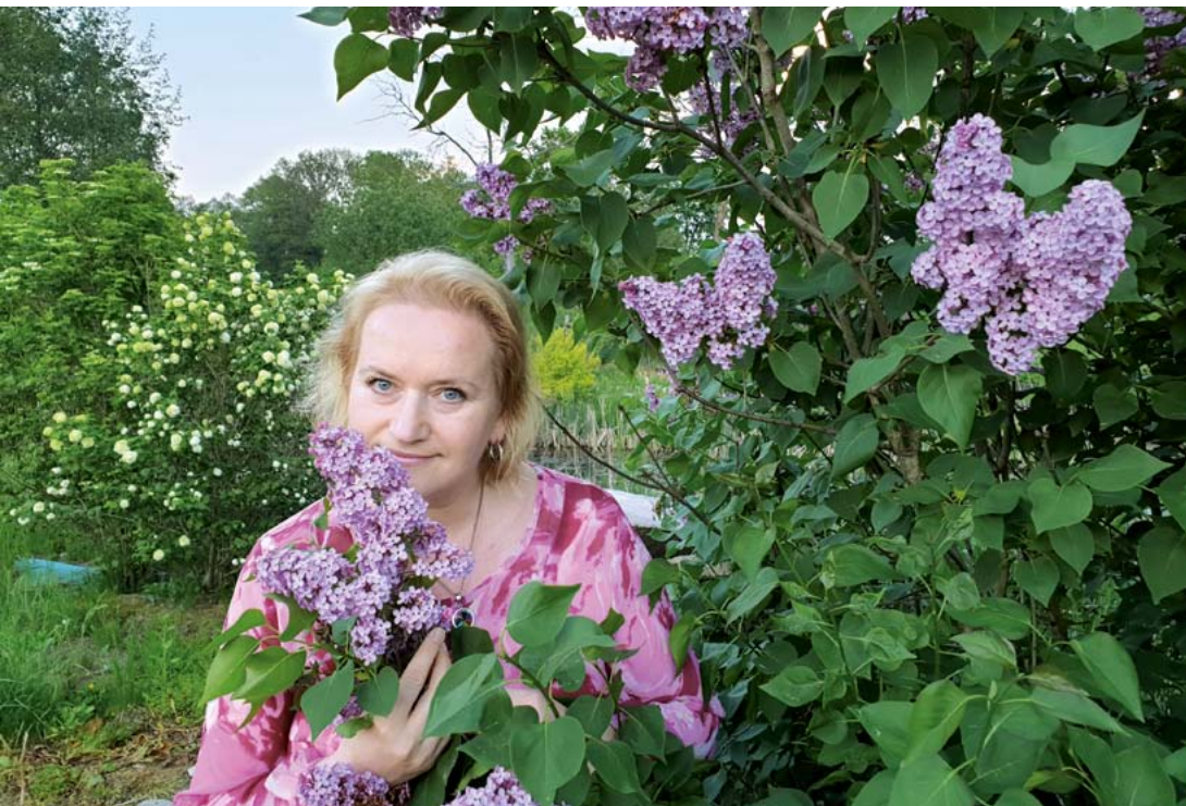
Króle, maj 2019