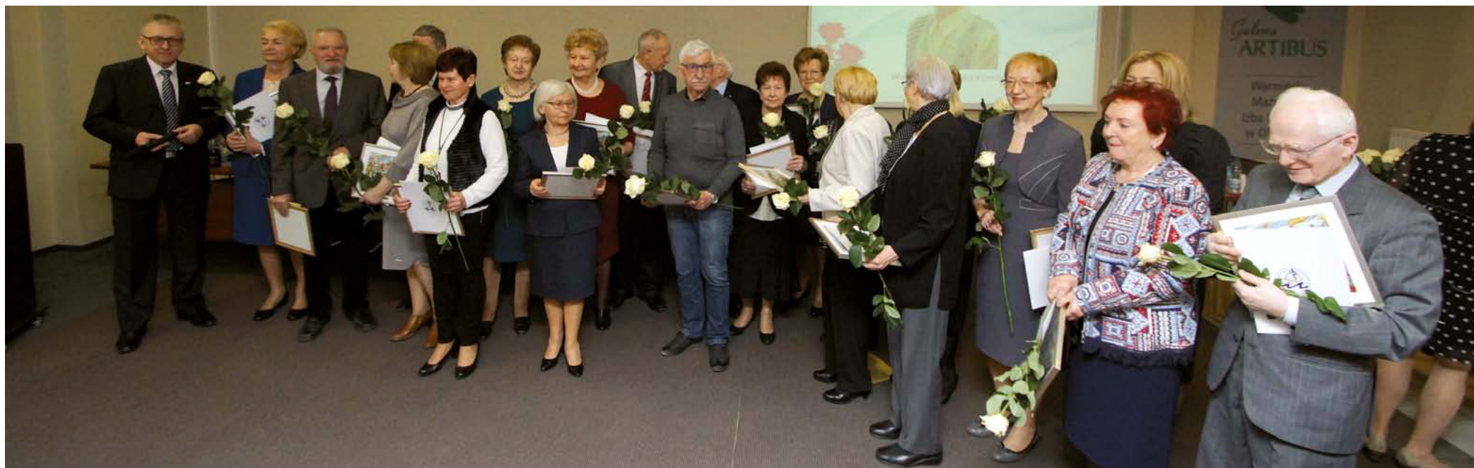
Nestorzy medycyny Warmii i Mazur 2019