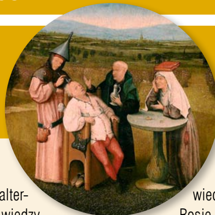
Leczenie głupoty, fragment obrazu Hieronima Boscha

Znachor, ongiś bardzo popularny, stanowił dla wielu środowisk alternatywę dla medycyny. Szukali go przede wszystkim ludzie o małej wiedzy, niezamożni, ze środowisk prostych i niewydukowanych, pozbawieni dostępu do lekarza. A i dziś spora liczba osób poszukuje ich pomocy, szczególnie w przypadkach chorób nowotworowych. Sądzę, że każdy z nas słyszał o ich praktykach, lecz wiedza o sposobach zalecanych przez nich jest skąpa.