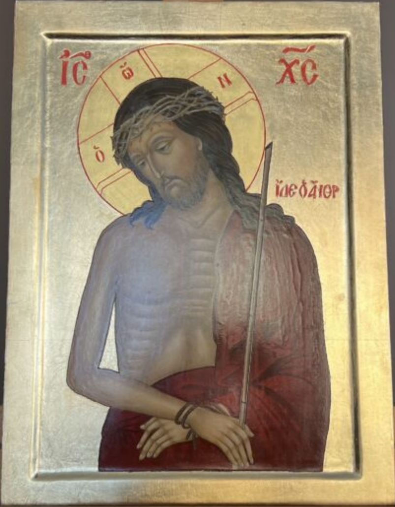
Jan KZUS OHYO